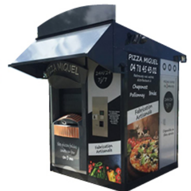
KIOSCO 333x250x360cm altura x anchura x profundidad