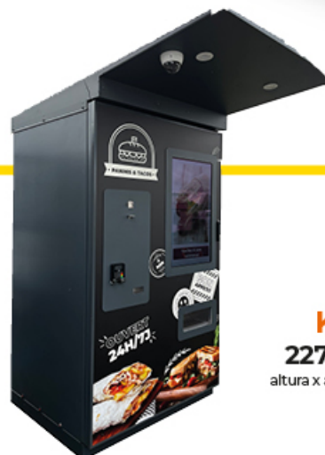
KIOSCO 227x111x195cm altura x anchura x profundidad