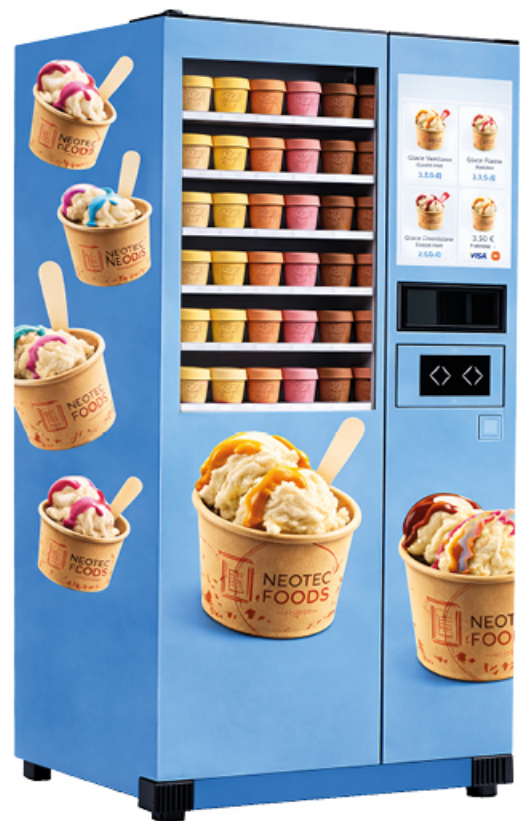
185x129x105cm altura x anchura x profundidad