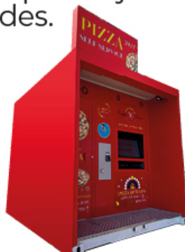
CONTENEDOR 259x243x299cm altura x anchura x profundidad