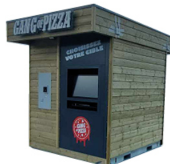
KIOSCO DE MADERA 265x250x360cm altura x anchura x profundidad