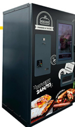
INDOOR 194x111x106cm altura x anchura x profundidad