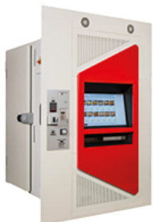
EMPOTRADO 240x155x240cm altura x anchura x profundidad

Elige la opción que mejor se adapte a tus necesidades.