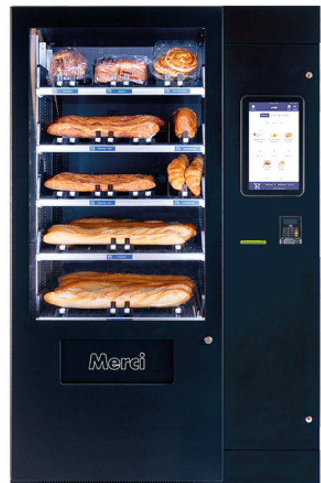
INDOOR 193x118x105cm altura x anchura x profundidad

Aumenta su atractivo programando ofertas especiales como “3+1 gratis”, descuentos de fin de día o promociones de fidelidad.