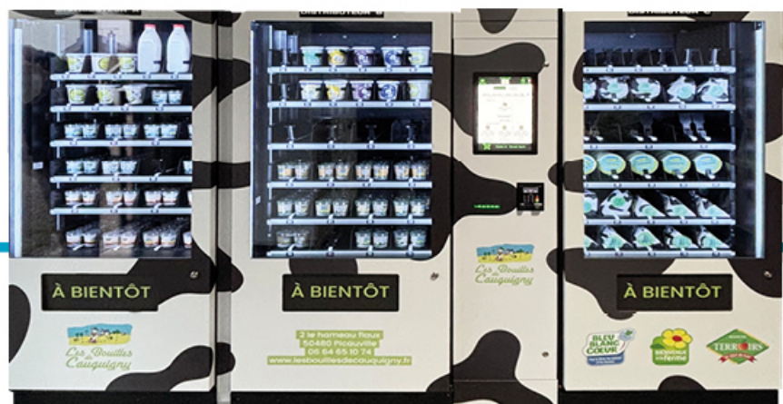
FreshMatic con varios distribuidores para lácteos