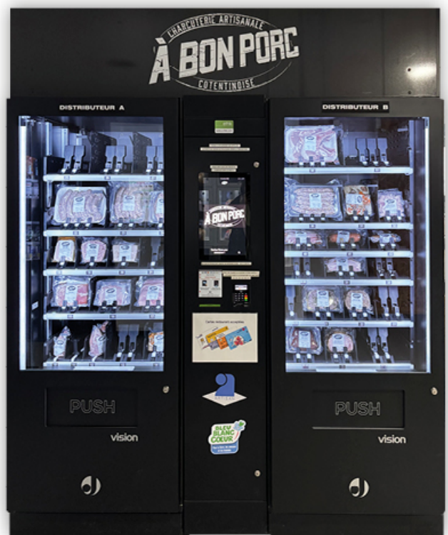
FreshMatic con dos distribuidores para carnicería y charcutería