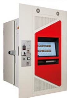
EMPOTRADO 215x240x240cm anchura x profundidad x altura

Elige la opción que mejor se adapte a tus necesidades.