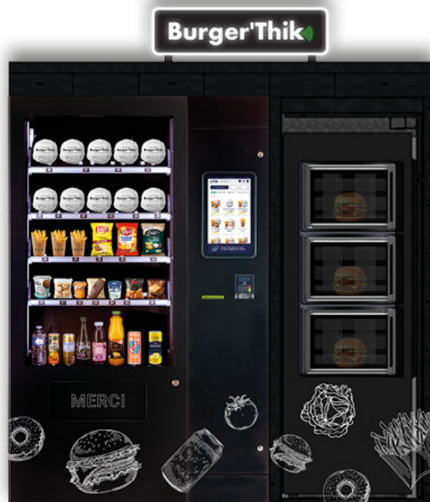
INDOOR 192x105x195cm anchura x profundidad x altura