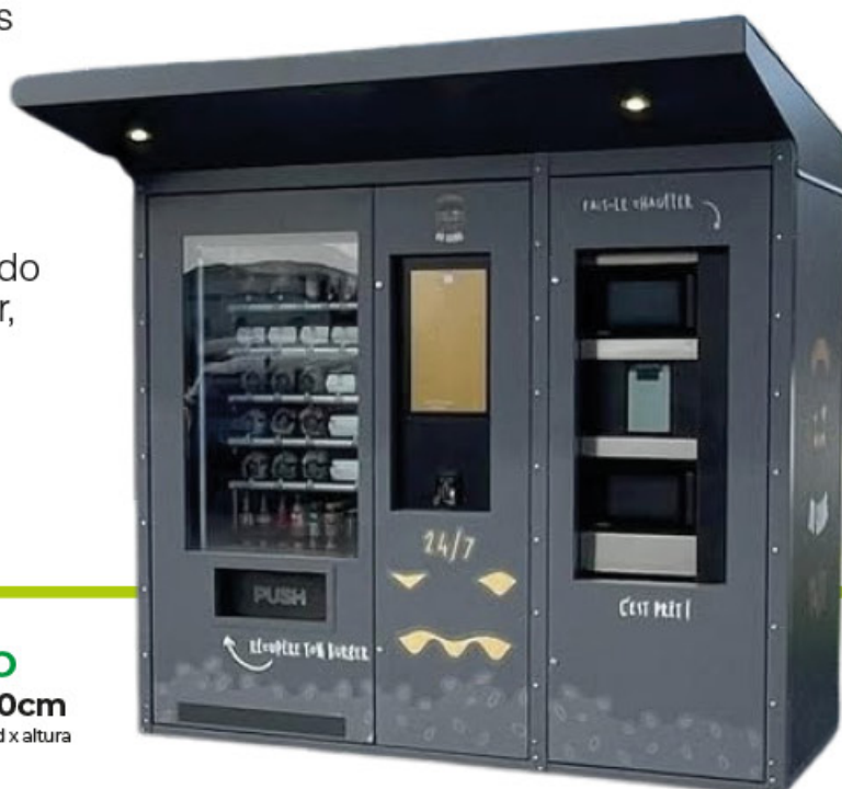
KIOSCO 237x197x230cm anchura x profundidad x altura