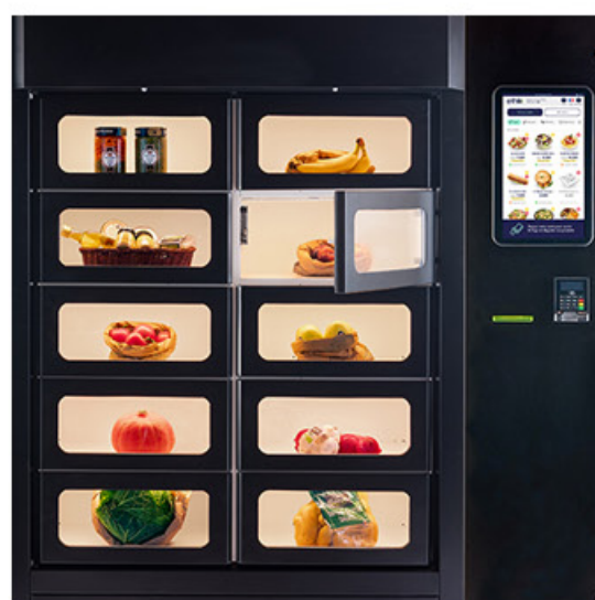
108x80x220cm anchura x profundidad x altura

DISPOSICIÓN MODULAR disponible en 12, 15, 18, 24, 32 taquillas de tamaño variable.