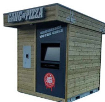
KIOSCO DE MADERA 250x360x265cm anchura x profundidad x altura