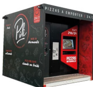
CONTENEDOR 243x299x259cm anchura x profundidad x altura