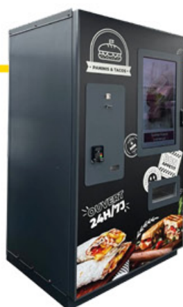
INDOOR 111x106x194cm anchura x profundidad x altura