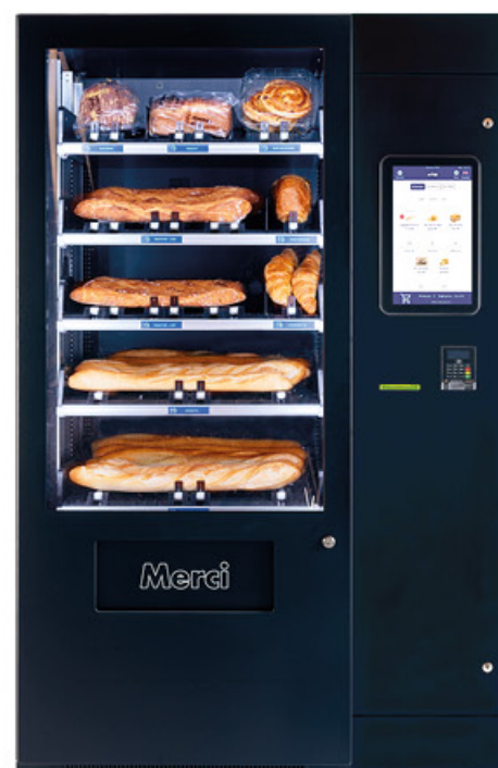
INDOOR 118x105x193cm anchura x profundidad x altura

Aumenta su atractivo programando ofertas especiales como "3+1 gratis", descuentos de fin de día o promociones de fidelidad.