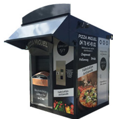
KIOSCO 250x360x333cm anchura x profundidad x altura