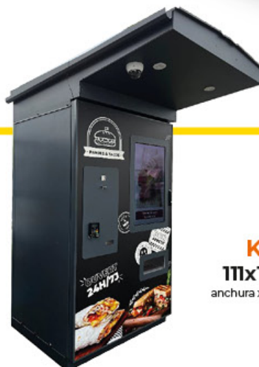
KIOSCO 111x195x227cm anchura x profundidad x altura